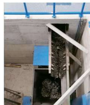
Trituratore Trucioli Interrato