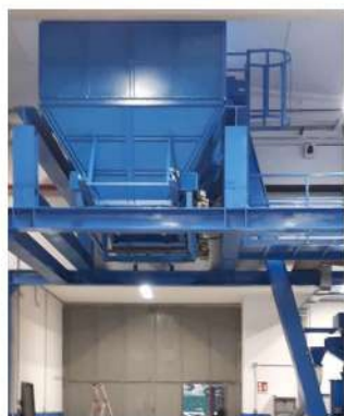
Silo Stoccaggio Trucioli