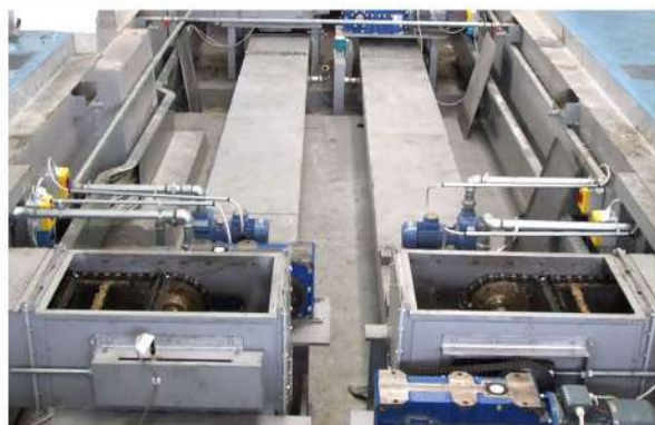
Linee Interrate Trasporto Trucioli