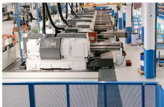
Scarico Trucioli Automatico Interrato