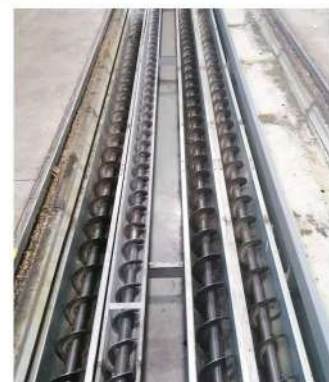
Trasporto Trucioli Interrato